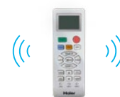
Sterownik bezprzewodowy YR-HE (standard)