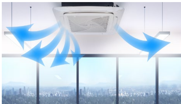
Sterowanie przepływem powietrza