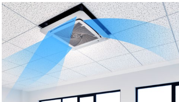
Rozwiązanie do montażu w sufitach podwieszanych

Maskownica posiada cztery osobne łopatki przepływu powietrza, które mogą być kontrolowane osobno w zależności od potrzeb użytkowników.