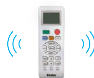
STEROWNIK BEZPRZEWODOWY YR-HE (STANDARD)