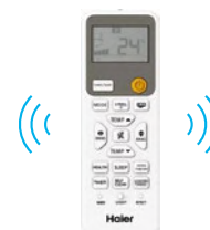
STEROWNIK BEZPRZEWODOWY YR-HE2 (STANDARD)